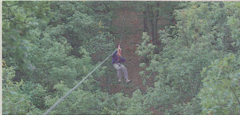
La hostelería, el transporte y el ocio son los sectores que tendrán mayor demanda de empleo.

"El dinamismo del mercado laboral castellanoleonés se refleja perfectamente en las previsiones para esta campaña de Semana Santa. El fuerte atractivo turístico de la región y el incremento de visitantes impulsan la contratación en sectores clave como la hostelería, consolidando a Castilla y León como uno de los principales motores de empleo estacional del país", asegura el director regional de Trabajo Temporal de la zona Norte de