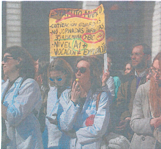
Otro momento de la protesta de ayer.

huelga un total de 1.311 facultativos de los 7.034 efectivos disponibles hoy en el turno de mañana. Por provincias, el seguimiento ha sido el siguiente: Ávila, 7,3 por ciento, 31 médicos en huelga; Burgos, 25,1 por ciento, 215 en huelga; León, 26,3 por ciento, 330; Palencia, 18 por ciento, 71 médicos; Salamanca, 15,6 por ciento, 197 facultativos; Segovia, 16,8 por ciento, 79; Soria, 24,6 por ciento, 54; Valladolid, 16,2 por ciento, 286 médicos; y