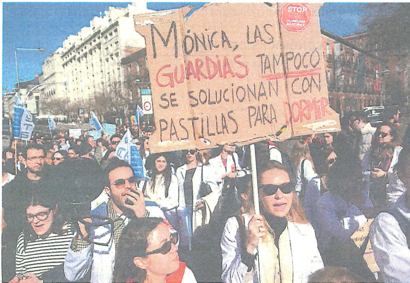
Los manifestantes rechazan la reforma pactada el pasado enero con los sindicatos generalistas.

Las posiciones entre estas organizaciones y Sanidad cada vez son más distantes y la propia ministra ve motivaciones políticas en unas movilizaciones que, lejos de caminar a su resolución, están agitando las críticas entre algunas comunidades. «Nos reuniremos todas las veces que hagan falta, pero sin trampas. Cada vez que hay un acuerdo, lo que ha habido es una escalada del conflicto y esto no responde realmente a las necesidades y las reivindicaciones de los profesionales», señaló antes de defender la reforma del Estatuto Marco que acordó el