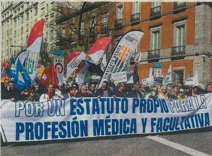
La huelga se ha apoyado en manifestaciones y concentraciones en todo el territorio nacional.

El paro convocado por los facultativos baja del 16,8% al 13,8% en sus dos primeras jornadas en la provincia, con una incidencia mínima en Atención Primaria