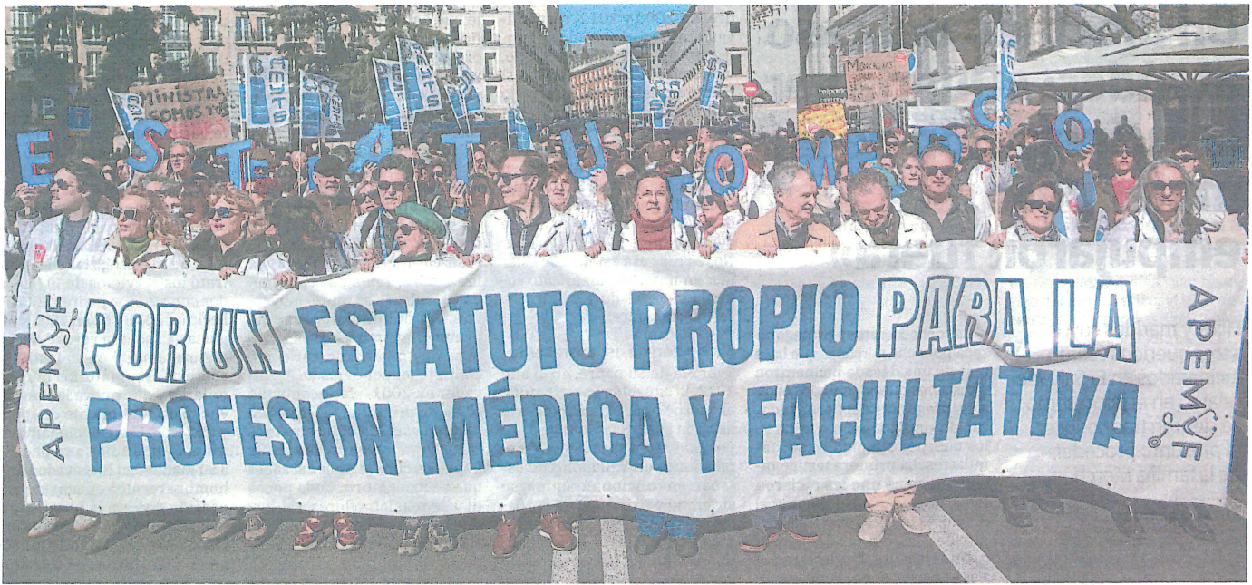
Concentración protesta de médicos celebrada este lunes en la capital de España.