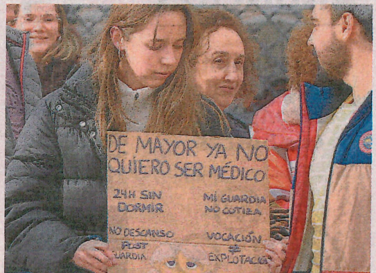
Concentración en protesta contra el Estatuto Marco Sanitario. L. G.

ras en su clasificación laboral que reconozcan los años de formación y especialización que no tienen otros graduados sanitarios, su responsabilidad en el proceso asistencial y la situación de las guardias. Son asuntos con repercusión retributiva y en cotizaciones para la jubilación y con reflejo en la gestión de personal y presupuestaria que hacen las comunidades autónomas, responsables de los servicios públicos de Salud. En el caso de Castilla y León, los médicos son personal en nómina de Sacyl. El Ministerio de Sanidad firmó en enero un acuerdo para el nuevo estatuto marco con organizaciones sindicales generales y otras representativas de la enfermería, pero en ese pacto no estaban los sindicatos médicos.